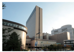
リーガロイヤルホテル