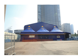
ルナ・レガール口※1/26にて終了