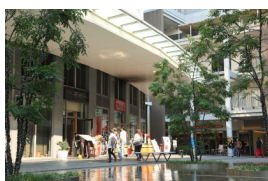
堂島クロスウォーク／ほたるまち

また、堂島川の水辺に位置し、京阪中之島線、JR東西線、阪神本線、JR環状線の4線4駅に徒歩圏、キタ・ミナミエリアにもアクセスしやすく、周辺には、現在建替え中の「関西電力病院」をはじめとするさまざまな利便性ととも、中之島公会堂、国立国際美術館、大阪市立科学館、ABCホール、堂島リバーフォーラムなど文化的な面も備えた多彩な都市機能を集約しています。