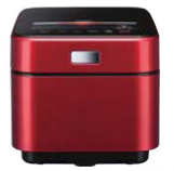
〔蒸気レスIHジャー炊飯器〕 三菱電機株式会社