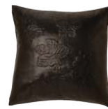
〔HOSOO URUSHI〕 株式会社細尾