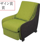
〔マッサージソファ〕 パナソニック電工株式会社