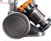
〔サイクロン掃除機〕 ダイソン株式会社