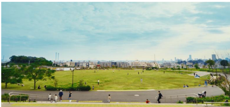
鶴見花月園公園(徒歩 1 分/約 60m)

本物件は、公園や街が眼下に広がる開放的な高台に位置しています。隣接する「鶴見花月園公園」は、かつて、東洋一の遊園地と謳われていた鶴見花月園があった場所で、その後、防災公園街区整備事業と位置付けられ、広大な防災公園として整備されました。「地域のみなさまの憩いの場」「地域の歴史の継承」「防災機能の確保」を目指した公園づくりが行われ、芝生広場やグラウンド、子ども向けの遊具があるゾウさん広場などに加え、万一の災害時に備え、炊き出しに活用できるかまどベンチやテントシートで覆って救護室などにも活用できるパーゴラ、マンホールトイレなどの防災設備も備わっています。一年を通じて、豊かな緑に彩られる常緑樹をはじめ、桜や紫陽花など四季を感じられる樹木が植えられており、憩いの場であるとともに、万一の際にも安心感をもたらす公園です。