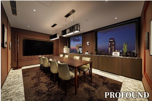
重厚で格調高いインテリアの中、落ち着いた趣に包まれる Room1

“ファッションを楽しむようにインテリアを楽しむ。”株式会社乃村工藝社が内装を手がけた商談室は、「PROFOUND」、「MODERN」、「MARINE」、「NATURE」がテーマの5室 ※ を設置。各室内は、横浜が持つ要素や魅力のエッセンスをインテリアデザインにアレンジしました。それぞれ個性のある室内で、『CREVIA』での新生活にご期待いただけるようなご提案をいたします。