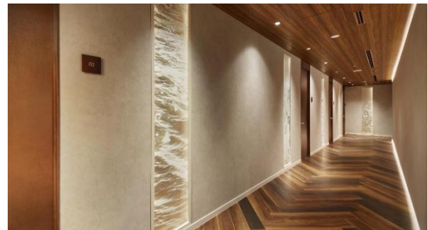
横浜の海をイメージして設えたデザインガラス

横浜の景色を眼下に臨む本ギャラリーは、随所に海や波や泡をイメージしたデザインガラスをレイアウトし、横浜由来の調度品を展示するなど横浜らしいイメージを演出。間接照明や木調を取り入れた天井・床面、座り心地や配置に配慮したインテリア・調度品など、“おもてなし”にこだわったラグジュアリーで落ち着いた空間です。