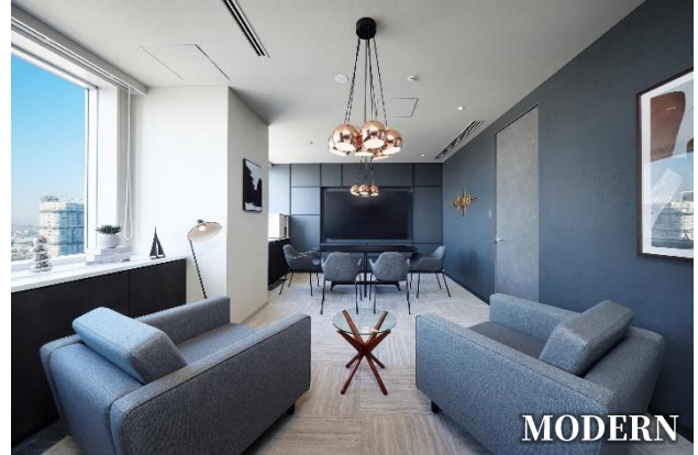
幾何学的な要素に上質な質感を加えたハイエンドな空間 Room2-3