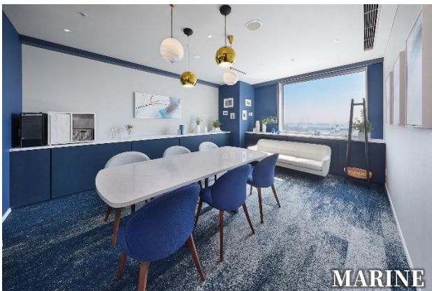
マリンテイストで素材の風合いも楽しめるファッションブルな Room4