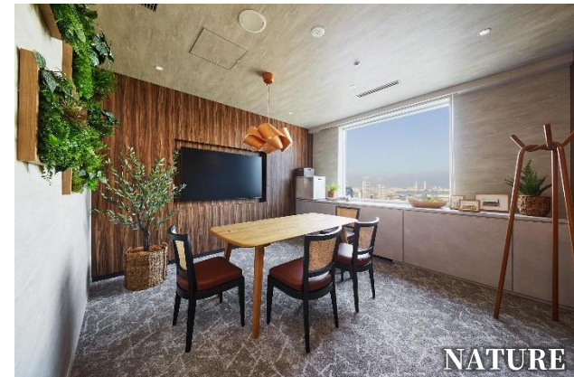
自然の素材感を持つ穏やかさとモダンなテイストが調和する Room5