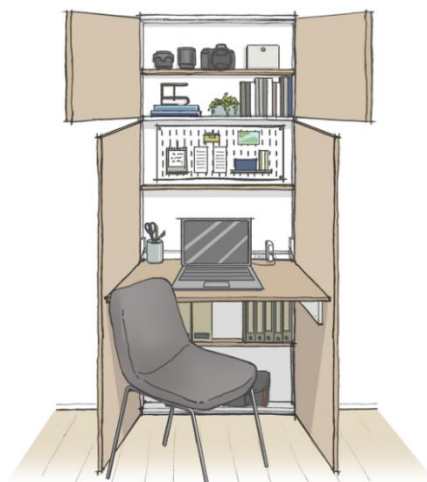
▲ デスク型完成予想イラスト

飾り棚に加えオプションで有孔ボードを設置すれば、棚板やフックを組み合わせ小物をよりすっきりと整理できます。