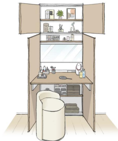
▲ ドレッサー型完成予想イラスト

オプションでミラーを追加すれば、プライベート感漂う贅沢なドレッサースペースとしても活用できます。