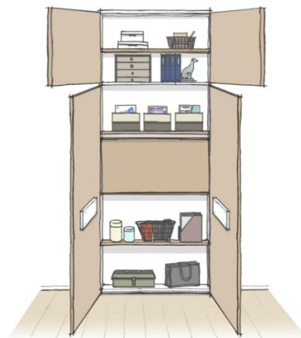
▲ 収納型完成予想イラスト

お部屋になじむよう、床やクロゼットに合わせたオリジナルの扉面材を使用しています。