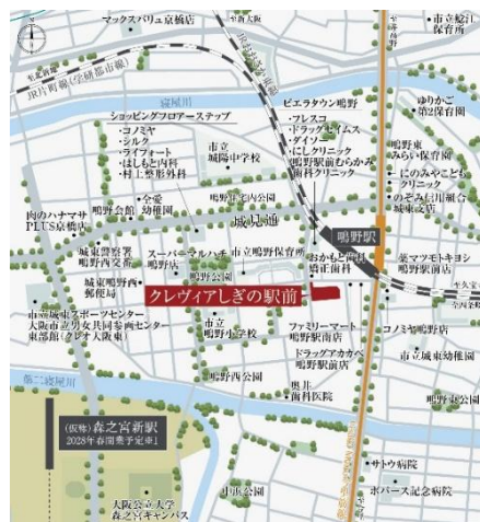
「クレヴィアしぎの駅前」現地案内図