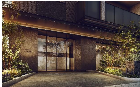
エントランス完成予想 CG