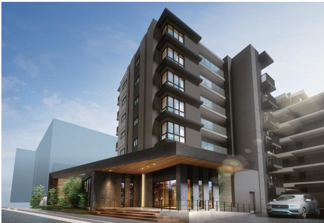
「クレヴィア和光」 外観完成予想 CG

※掲載の完成予想 CG は、計画段階の図面を基に描き起こしたもので、形状・色彩・外構・植栽等は実際とは異なります。形状の細部・設備機器・配管等は簡略化の上、表現しております。今後、行政指導・施工上の理由等により、計画に変更が生じる場合があります。樹木・植栽は、特定の季節やご入居時の状態を想定して描かれたものではありません。実際に植樹する樹形・枝ぶり・葉や色合い等が異なる場合があります。尚、竣工時には完成予想 CG 程度には成長しておりません。周辺の建物、電柱、電線、ガードレール等は簡略化して表現しています。