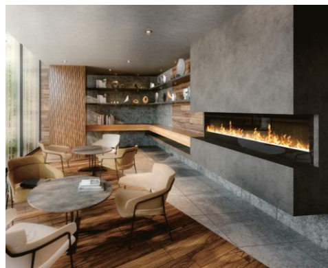
ラウンジ完成予想 CG

前庭の緑とレインシャワーをイメージした窓ガラス、木質感溢れる空間が、森の気分を深めるラウンジ。インテリア暖炉の“燃えない炎”に癒され、一人の時も集いの時も心が休まるサードプレイスです。