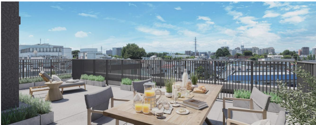
Irタイプ／ルーフバルコニー完成予想 CG

間取りは、全ての住戸を南東・南西向きの3LDKとし、全居室に開口を設けた角住戸プランや、42㎡超のルーフバルコニー付き角住戸プラン、専用庭付きプランなど、60㎡台～80㎡台の多彩なプランをご用意しました。