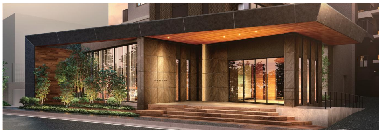
エントランス完成予想 CG

旧川越街道沿いに設えたエントランスは、前庭と一体的なデザインとし、広がりのある庇が、空間の広がりとスケール感を創出します。エントランスや前庭のガラスの向こうに内部が見え隠れする開かれた印象は、かつてこの街道沿いに連なっていた宿場町の街並みをオマージュ。土地の歴史や風情を継承し、モダンで落ち着いた佇まいを演出しました。