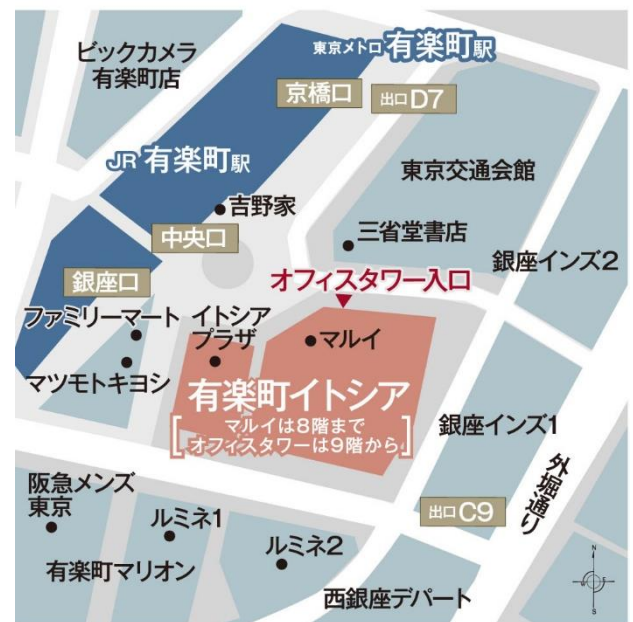
「ギャラリークレヴィア有楽町イトシア」案内図