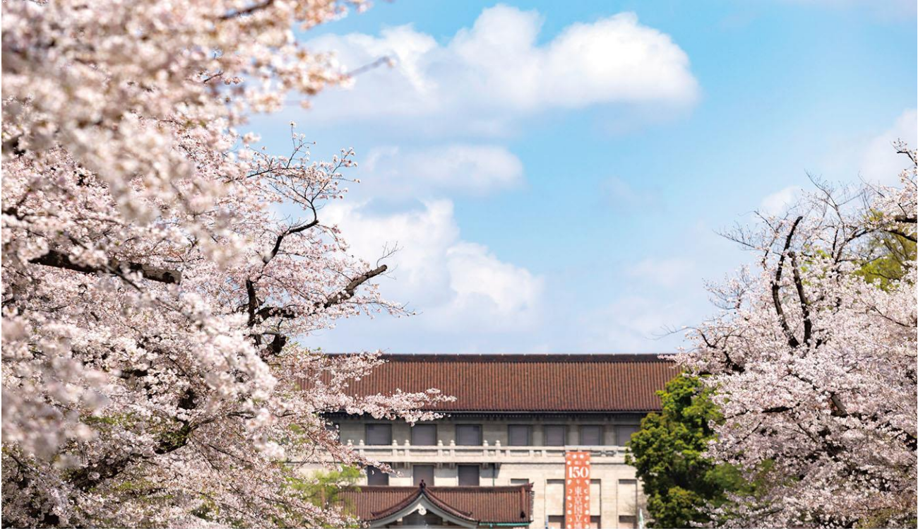
上野恩賜公園 徒歩8分(約590m)

「クレヴィア上野入谷」は、緑に包まれた文化・芸術の杜「上野恩賜公園」へ徒歩8分という恵まれたロケーションです。広大な園内に博物館や美術館、動物園、さらに不忍池や東照宮などが集結した「上野恩賜公園」が日常の庭となるポジションにあり、文化・芸術と自然の潤いを日常に体感する事ができる環境です。また、本物件が位置する入谷・根岸エリアは、江戸や明治からあるお寺や神社も点在し、趣のある街並みです。