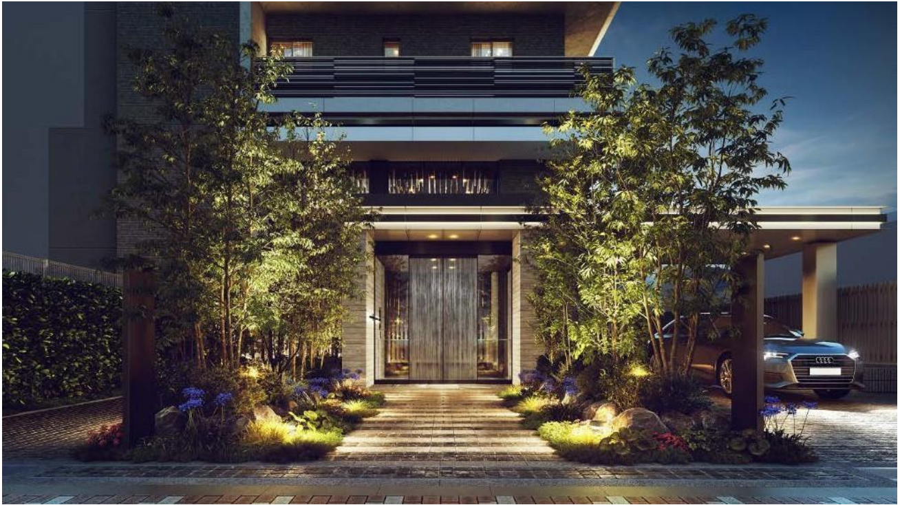
エントランスアプローチ完成予想CG

エントランスホールへと優雅に誘う、奥行き感あるアプローチ。大きな庇に二層吹き抜けの空間が風格を醸し出すファサードは、街に品位あるシンボリックな景観を映し出します。