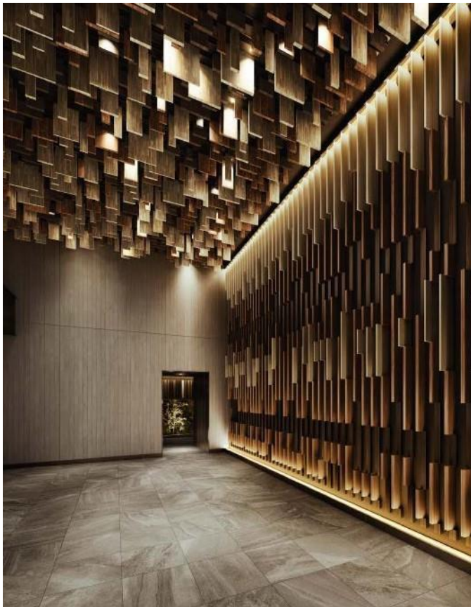
エントランスホール完成予想CG

エントランスホールは木板を多用した伝統美とモダンの融合空間を実現。独創的なアート空間が住まう人を優雅に迎え入れます。また、エントランスホールからエレベーターへと向かう間には爽やかな緑景を眺められるグリーンコリドーを設け、通るたびに癒しを与えてくれる空間としました。