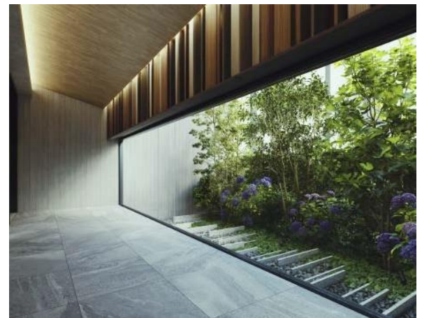
グリーンコリドー完成予想CG

エントランスホールは木板を多用した伝統美とモダンの融合空間を実現。独創的なアート空間が住まう人を優雅に迎え入れます。また、エントランスホールからエレベーターへと向かう間には爽やかな緑景を眺められるグリーンコリドーを設け、通るたびに癒しを与えてくれる空間としました。