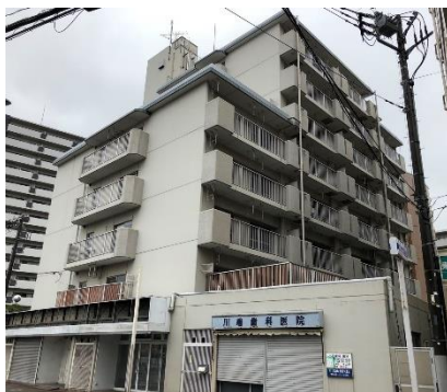
建替え前「グリーンコーポ朝霞台第2」

今後も、伊藤忠都市開発は、これまで積み重ねてきた実績とノウハウに基づく合意形成力を活かし、個々の区分所有者様に寄り添いながら、安全で快適なマンションの建替え事業に積極的に取り組んでまいります。