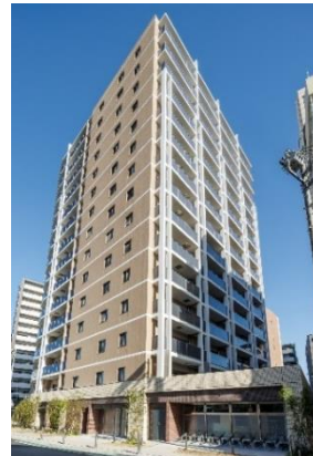
建替え後「クレヴィア朝霞台」