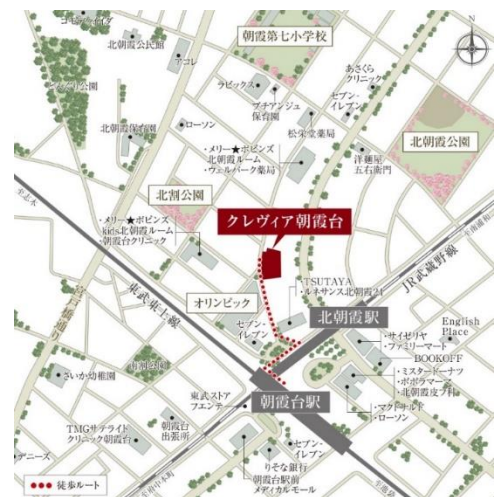
「クレヴィア朝霞台」位置図