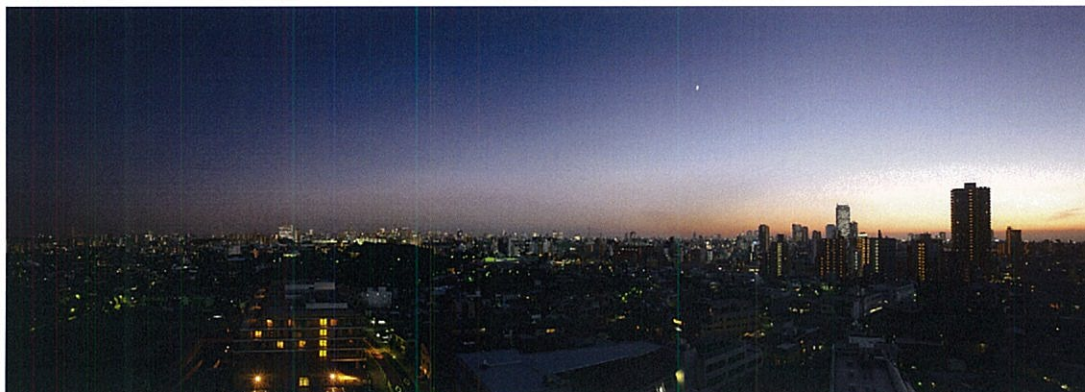
<2009 年 9 月撮影>

東京スカイツリー(建設中)、東京ドーム、東京タワー、ミッドタウン、新宿副都心、サンシャイン 60 等、眼下に都心を一望できる眺望も魅力です。