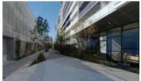
交流広場/憩いのプロムナード