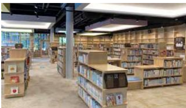
新西図書館

蔵書数 30 万冊。予約図書の自動受取機や返却ポストを設け、時間帯を問わず利用できます。また、キッズスペースにお子様を預けて本を探すことも可能。多様な閲覧空間も設け、開かれた図書館として機能します。