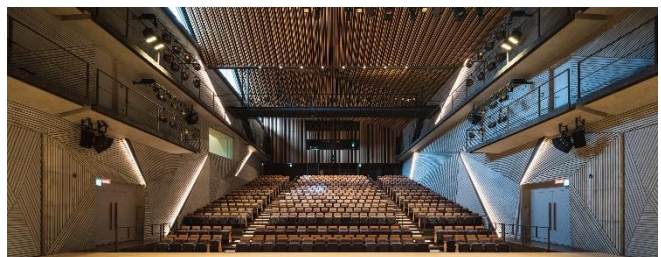
文化・芸術ホール