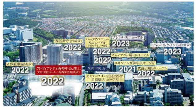
現地周辺写真(2020年8月撮影)

市営地下鉄「西神中央」駅前には、神戸市と民間企業の手による官民一体の一大プロジェクト「リノベーション神戸」で進化。2021年の「西区新庁舎」新設を皮切りに、「クレヴィアシティ西神中央」と同時に、文化施設、商業施設、動線の整備まで、街全体が生まれ変わり、2023年には「こべっこあそびひろば」新設も予定されるなど、大きな期待を集めています。