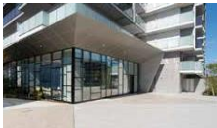
交流モール/交流広場