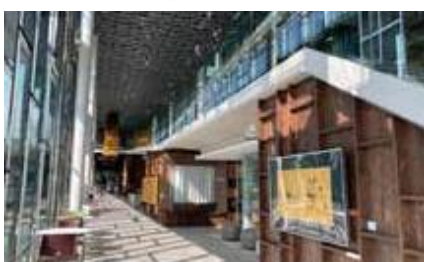
交流モール/アートウォール