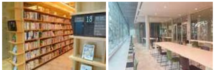
新西図書館