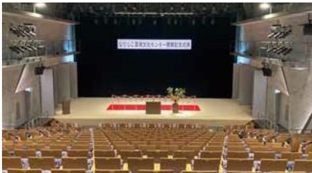
文化・芸術ホール

生まれ変わる西神中央の中でも、「クレヴィアシティ西神中央」と、2022年10月1日(土)に開館した、「神戸市立西図書館(移転)」と「西神中央ホール」の複合施設「なでしこ芸術文化センター」の一体整備は大きな話題の一つ。図書館は、1階に児童書、2階3階に一般書が配置され、「おはなしの部屋」、「対面朗読室」、「セミナー室」など様々な目的・多世代の利用者が快適に過ごすことのできる、開かれたギャラリースペースです。500席規模のホールでは、プロによる公演はもちろん、市民サポーターの養成、近隣アーティストの起用や育成、鑑賞後の交流会も実施されるなど、ジャンル・地域・世代を超えて文化芸術の素晴らしさを伝える施設です。また、「西神中央」駅直結の歩行者デッキや、本件と「なでしこ芸術文化センター」をつなぐ開放的な「交流広場」や「憩いのプロムナード」などが新街区生活を心地良く、美しく演出します。