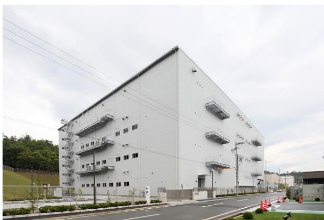
(仮称)箕面森町物流施設 外観

当社は今後も首都圏・関西圏を中心に積極的に物流施設の開発を行うとともに、総合デベロッパーとしての不動産開発ノウハウと、伊藤忠グループの豊富な顧客リレーションなどの強みを発揮し、物流インフラを発展させることで豊かな社会づくりに寄与してまいります。