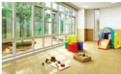
キッズルーム完成予想CG