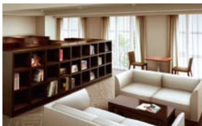
ライブラリ完成予想CG