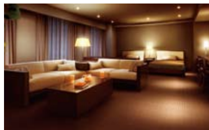
ゲストルーム完成予想CG

『クレヴィア若葉台パークナード』が採用したのは、全288邸の“大規模低層邸宅”という発想です。約2万3,000㎡の敷地に、地上5階建・全6棟を配置。「大規模プロジェクトならではの伸びやかさ」と「低層邸宅ならではの落ち着き」を同時に実現しています。さらに、全6棟の住棟を豊かな緑で包み込む植栽計画、敷地内駐車場100%（総戸数に対応）も実現するなど、永住のためのマスタープランを採用しています。