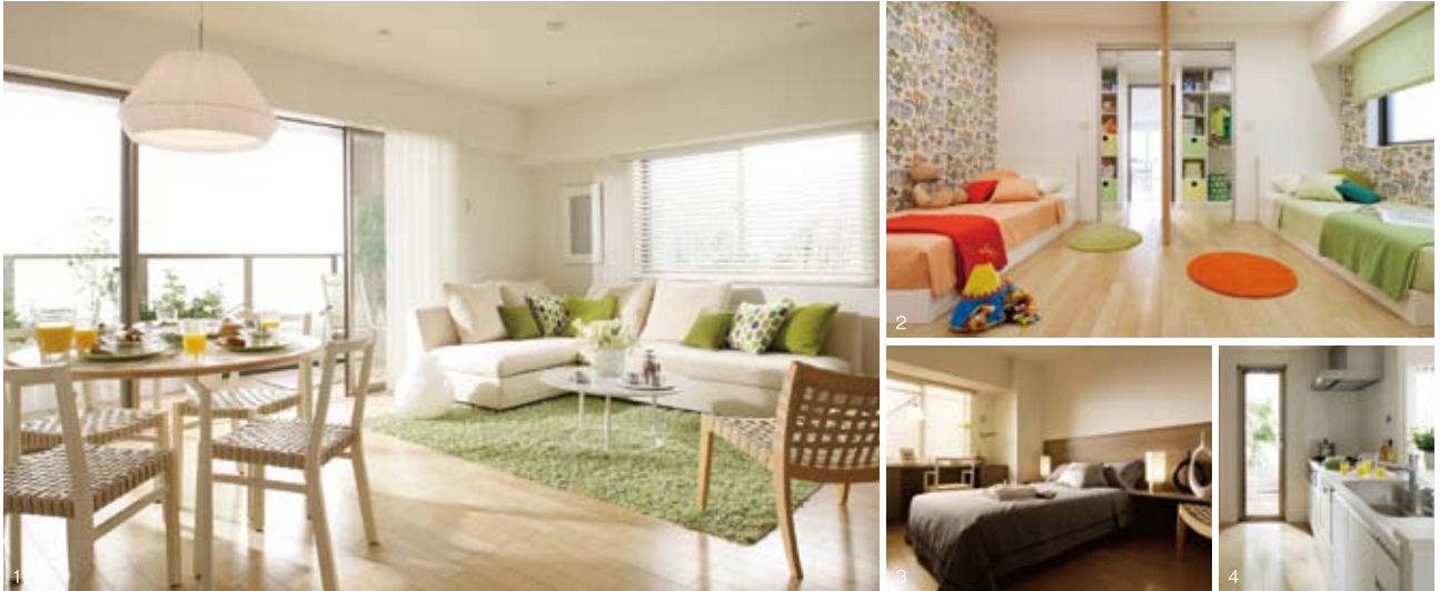
1.リビング・ダイニング 2.ベッドルーム 3.マスターベッドルーム 4.キッチン

※掲載の写真は、モデルルーム（100Dタイプ：モデルルームプラン）を平成21年4月に撮影。一部CG処理を施したもので実際とは異なる場合があります。 また、一部有償オプションや家具・調度品等が含まれており、これらは販売価格に含まれておりません。