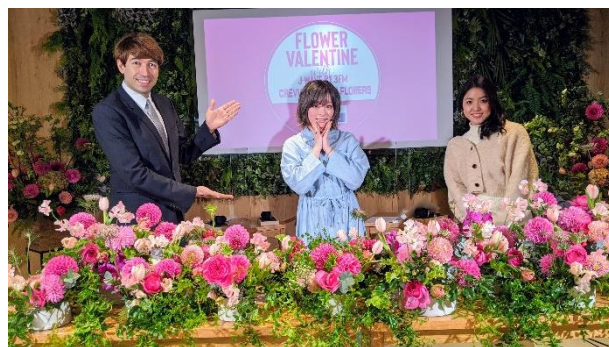
左からサツシャさん・きゃりーぱみゅぱみゅさん・増井なぎささん

「ギャラリークレヴィア新宿」は「従来の“マンションを販売するための施設”にとどまらず、様々な方が自由に集い、楽しみ、コミュニケーションが広がる場」となることを目指しており、施設内には、販売中物件のモデルルームや商談ブースのほか、どなたでも自由にご利用いただけるコミュニケーションスペースを設けています。平常時は、オリジナルブレンドのコーヒーや紅茶を楽しんでいただくカフェスペースとして、イベント開催時にはイベント会場として活用しております。