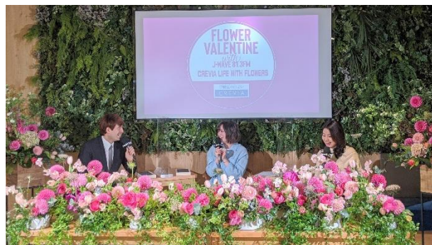
花装飾を施したギャラリークレヴィア新宿にて、「花のある暮らし」について語るきゃりーぱみゅぱみゅさん(中央)