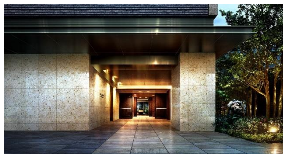
エントランス完成予想 CG