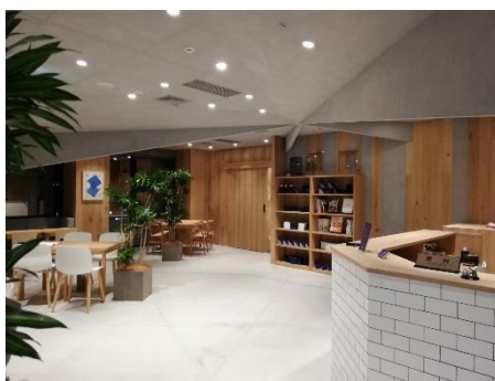
無料カフェスペース