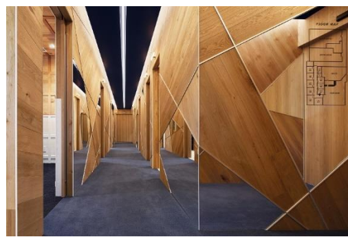
木材を使用した内観