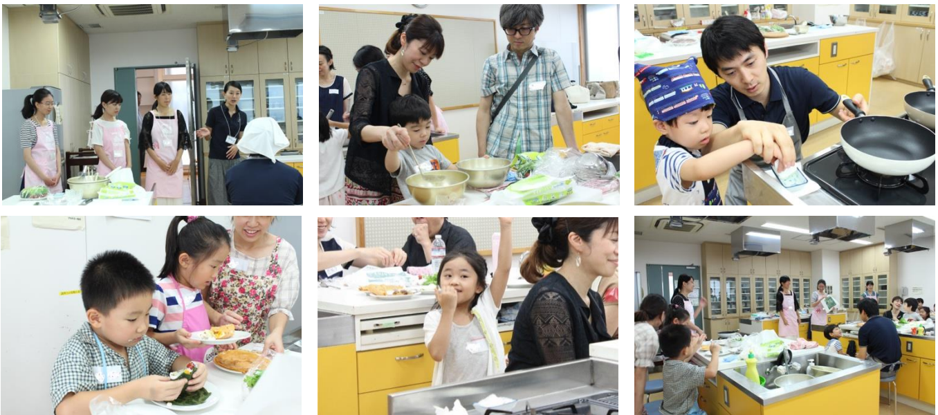
「Ochas」の皆さんに教わりながら親子でクレープ作りを楽しむ皆さん

まずは、ほうれん草・紫いも・にんじんの3種類のカラフルなクレープの生地づくり。火のつけ方や調理器具の使い方を教えてもらいながら、子どもたちが一生懸命に取り組みました。焼き上がったら、ツナやレタスなどのおかず系とフルーツ、チョコソースなどスイーツ系の好きな具をはさんで完成。自分たちで作ったクレープを食べながら、笑顔がこぼれていました。「Ochas」による食育クイズにも積極的に手を挙げて参加するなど、“食”を楽しく学びながら、講師の方々や入居予定者同士の交流が生まれたイベントとなりました。