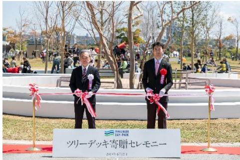
【千葉市長によるツリーデッキ前テープカットセレモニーの様子】

※「第1期街開き」は、10年超に渡る幕張ベイパーク街づくりにおける分譲住宅事業第1弾「幕張ベイパーク クロスタワー&レジデンス」の入居開始、および「イオンスタイル幕張ベイパーク」、「幕張ベイパーク クロスポート」、「TENT 幕張」等の施設のグランドオープンを指しています。