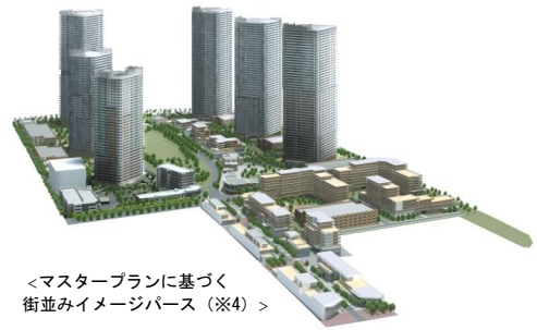
<マスタープランに基づく街並みイメージパース (※4) >

「幕張ベイパーク」は、10年以上 (※1) をかけて、総面積 17 万 5,809 ㎡の 8 区画に約 4,500 戸 (※2) の住宅機能を整備し、約 1 万人 (※3) が暮らす街を開発するプロジェクトです。米国オレゴン州のポートランドをモデルに、地区中央に位置する若葉 3 丁目公園(千葉市所有)を取り囲むように設計され、多様な機能を併せ持つミクストユースの賑わいある街づくりを目指しております。数多くの秀作を残し、世界を舞台に活躍する建築家、光井純氏が「幕張ベイパーク」全体のデザインガイドラインを監修。クロスタワー & レジデンスやスカイグランドタワーの外観等デザインも手掛けています。