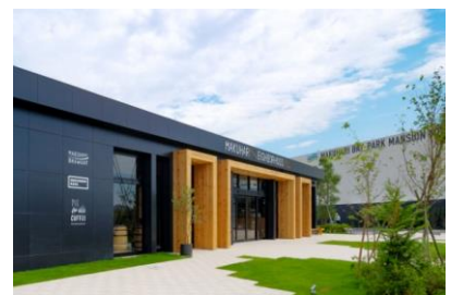
「MAKUHARI NEIGHBORHOOD POD」 外観写真