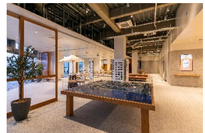
「幕張ベイパーク クロスポート」 内観写真

HP: https://www.b-pam.com/ (一般社団法人幕張ベイパークエリアマネジメントの HP です。)