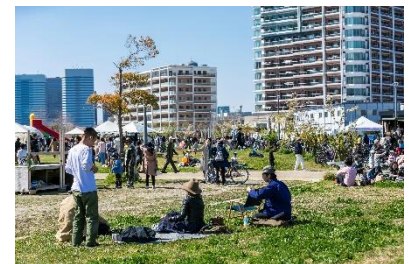
「幕張ベイパーク ピクニック」 開催模様