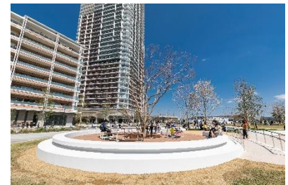
「若葉3丁目公園ツリーデッキ」 完成写真

※「景観形成推進地区」とは「景観計画区域内において、地域の特性を生かし、先導的な景観形成を図る必要がある特定の地区」を指します。2019年1月4日付千葉市告示第3号にて幕張新都心若葉住宅地区が千葉市の景観形成推進地区に指定されました。