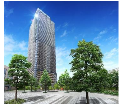
「幕張ベイパーク スカイグランドタワー」 完成予想CG(※)

本施設の取り組みは、より魅力的な景観形成を実現する施設として「千葉市都市文化賞2018(景観まちづくり部門)」を受賞いたしました。