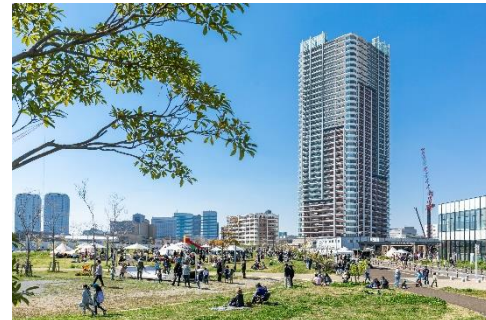
【若葉3丁目公園での交流イベントの様子】

当日は、「幕張ベイパーク」の街づくりに関する概要説明会、若葉3丁目公園内に完成する「ツリーデッキ」の千葉市への寄贈セレモニーのほか、「イオンスタイル幕張ベイパーク」や「幕張ベイパーク クロスポート」、「TENT 幕張」などの新規開業施設の自由見学会、住民による交流イベントが催されました。それらを通し、「幕張ベイパーク」だからこその、公園を中心に街全体を活かしたアクティビティや、様々な施設、機能を集約したミクストユースな暮らし、また“住民が主体となって取り組む”新たなエリアマネジメントにより醸成される街の賑わいを体感いただけたりとなりました。