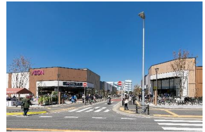
「イオンスタイル幕張ベイパーク」 外観写真