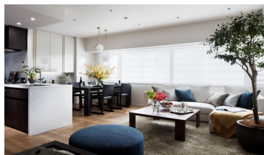
モデルルーム写真