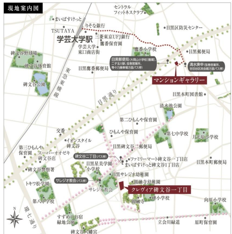
現地・マニションギャラリー案内図