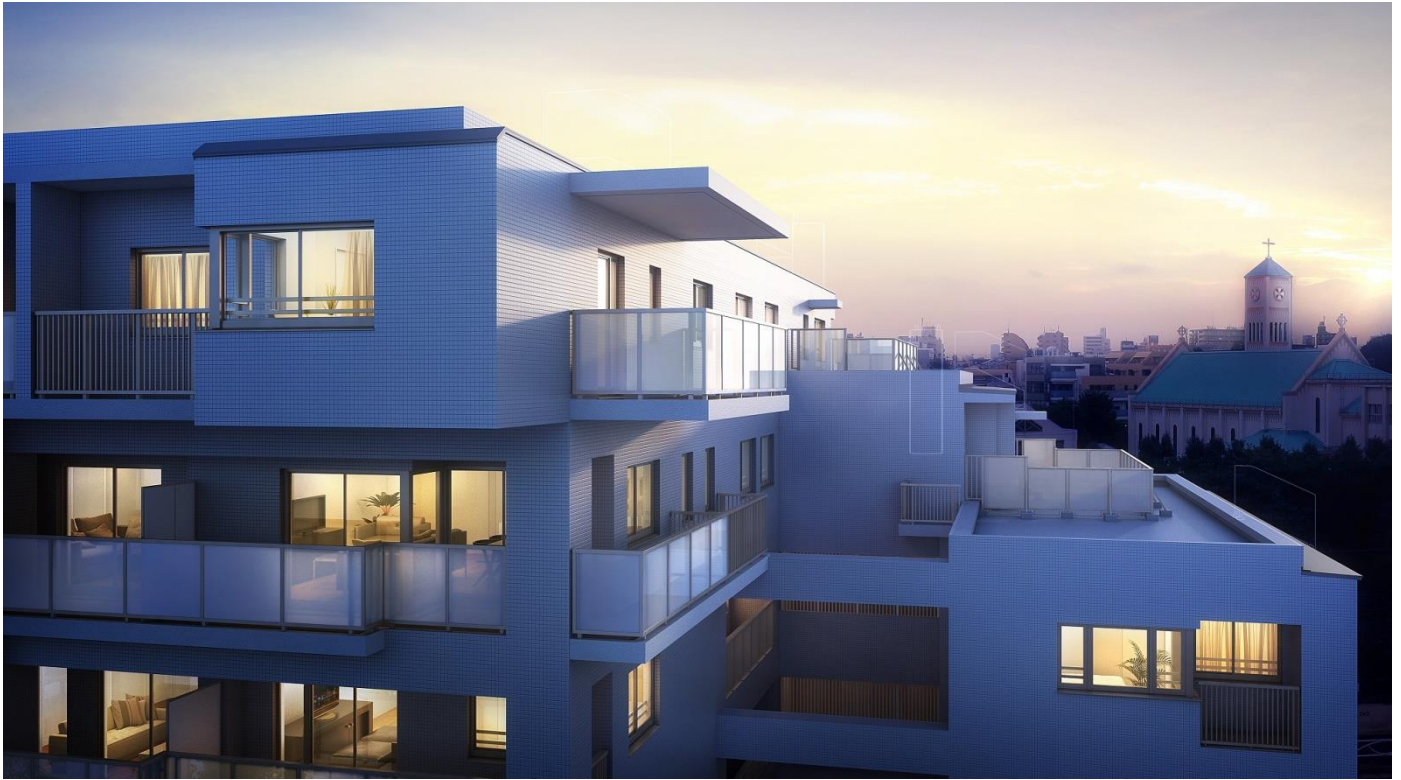
サレジオ教会を望む外観完成予想CG