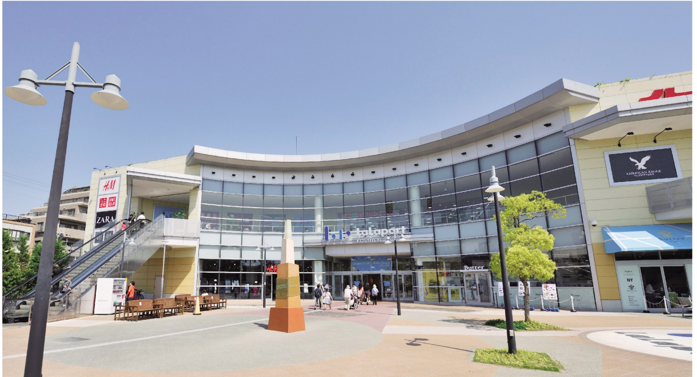
ららぽーと甲子園 (徒歩12分 / 約910m)

本件から徒歩12分の大型商業施設「ららぽーと甲子園」には買い物に便利な「イトーヨーカドー」、子供が職業体験できる「キッズニア甲子園」が併設されています。また、本件周辺は「ダイエー」や「コーナン」・「ジョーシン」などの商業施設も集中する等、高い生活利便性が甲子園エリアの大きな魅力となっています。