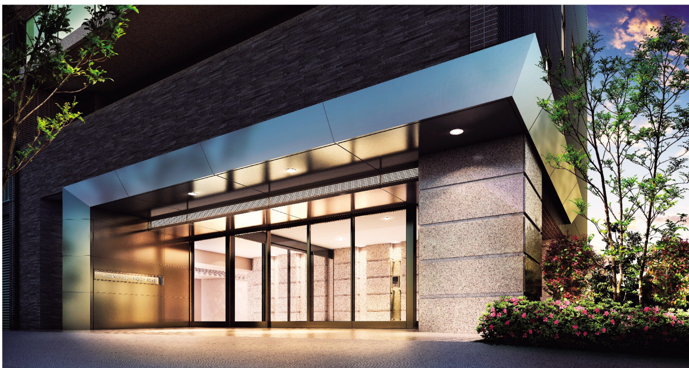
エントランスアプローチ完成予想図