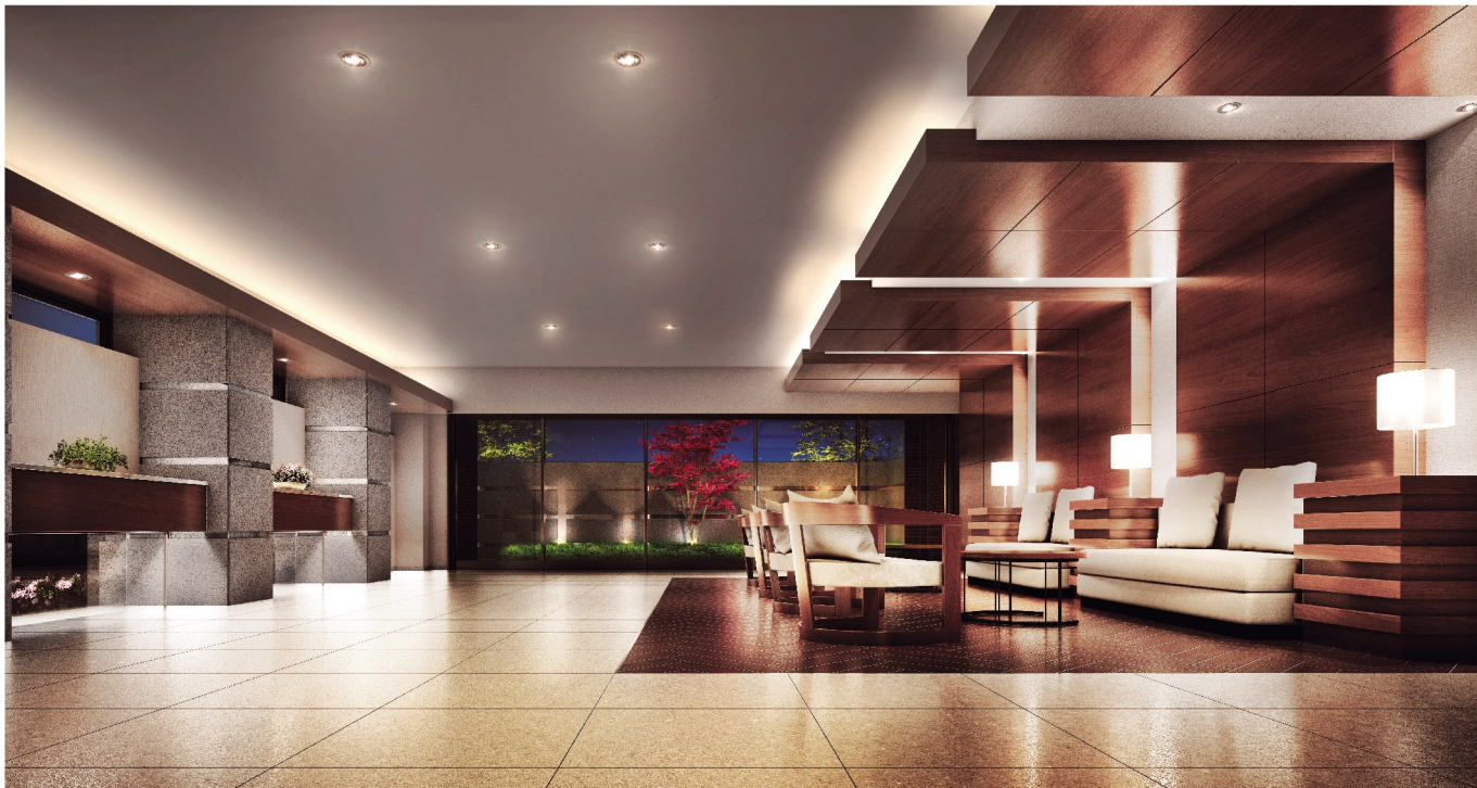
エントランスホール完成予想図

本件のエントランスホールにはラウンジを設置。デザインはガラス・石・タイルなど、マテリアルの持つ色や質感を効果的に組み合わせて、ホテルライクの上質空間を演出するとともに、奥のテラスにはイロハモミジを配するなど、四季を感じられるランドスケープデザインを採用しています。また、エントランスアプローチには庇のアルミパネルと御影石の柱を配する等、阪神間モダニズムを意識した共用部デザインとしています。