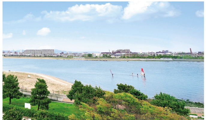
甲子園浜海浜公園 (徒歩7分 / 約500m)