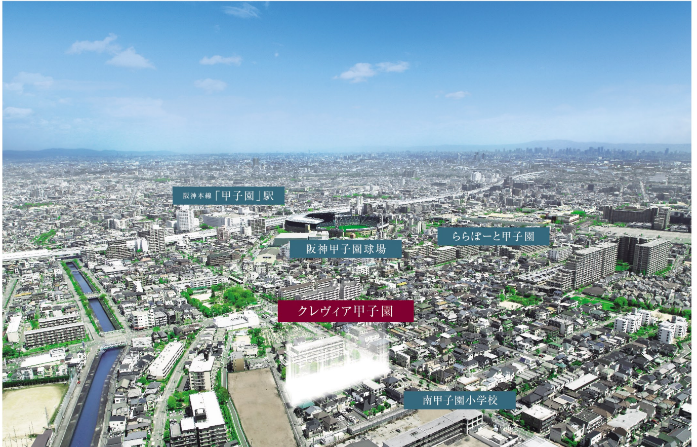
現地付近上空からの航空写真

阪神間モダニズムの歴史と西宮七園の邸宅文化を受け継ぐ甲子園は、武庫川女子大学甲子園会館(旧甲子園ホテル)や松山大学温山記念会館(旧新田邸)など、当時の面影を残す建物が現在も建ち並んでいます。近年、阪神甲子園球場を核とするレジャー拠点として「ららぽーと甲子園」などの商業施設が集まる生活利便性の高い甲子園エリアは、閑静な住宅街を維持しながら都市機能の進化を続けています。