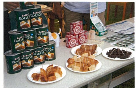
ご紹介させていただいた非常食