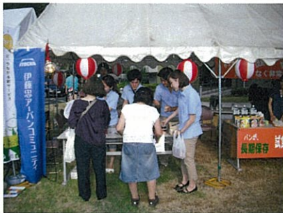
非常食試食・販売会の様子