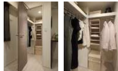
ウォークインクローゼット

衣類やバッグなどを収納できるウォークインクローゼットを全戸に設置。取り出しやすく、すっきりと整理整頓でき、室内を美しく保つことができます。