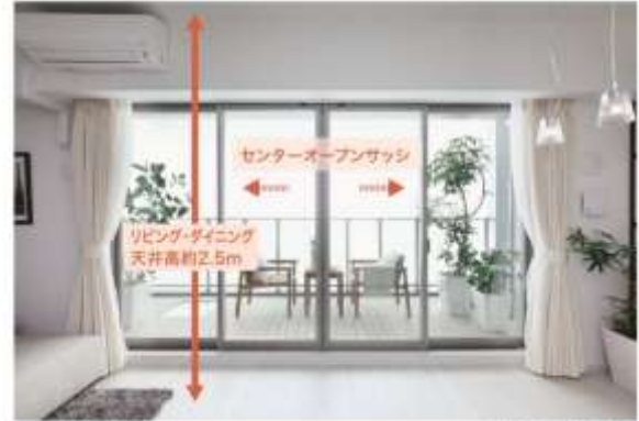
センターオープンサッシ

天井が高ければ、居住空間をより広く感じることができます。 各居室の天井高を約 2.5mとしており、伸びやかな空間となります。