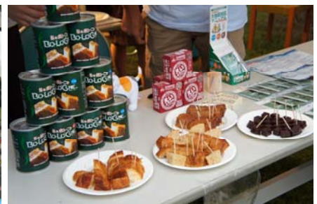
ご紹介させて頂いた非常食