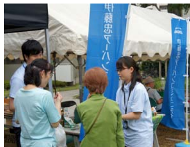
非常食試食会の様子