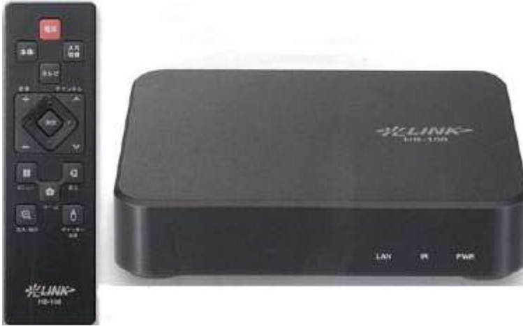
■セットトップボックス

各専有部に設置する機器「セットトップボックス」により、ご自宅のテレビの画面で電力使用量を見える化します。エコネットライト対応家電を節電コントロールし効率的に省エネを図ることが可能です。