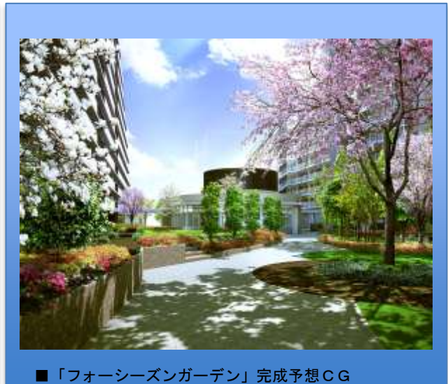
■「フォーシーズンガーデン」完成予想CG