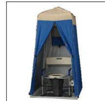
■マンホールトイレ(参考写真)