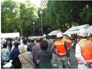
■防災訓練の様子(イメージ)

多摩平の森自治会やクレヴィア ライフ・ハグが実施する防災関連イベント（防災訓練・AED講習会など）にお互いの居住者が参加できるようにし、イベント時には、お互いの居住者が共用施設の一部を利用できる環境を整え、多摩平の森に住む住民同士がイベントを通しコミュニティを育める仕組みづくりも取り入れました。