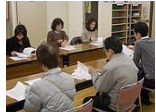
■防災マニュアル作成の様子(イメージ)