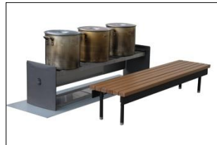
■かまどベンチ(参考写真)