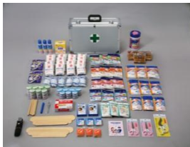
■50人用救急セット(参考写真)