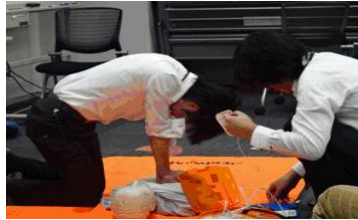
■AED講習会の様子(イメージ)