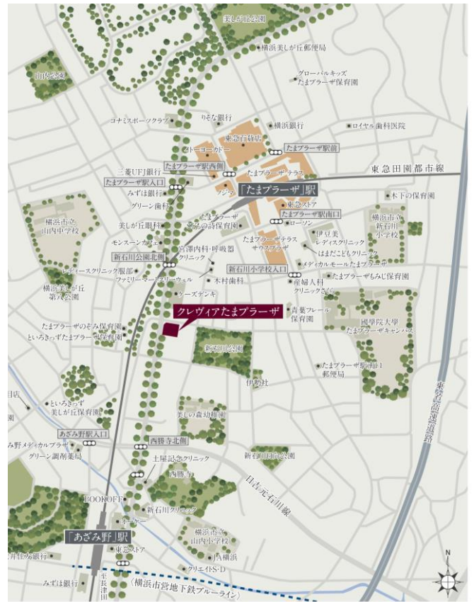
【「クレヴィアたまプラーザ」現地案内図】

所在地：神奈川県横浜市青葉区新石川二丁目 13 番 1(地番) 交通：東急田園都市線「たまプラーザ」駅徒歩 7 分 東急田園都市線「あざみ野」駅徒歩 9 分 横浜市営地下鉄ブルーライン「あざみ野」駅徒歩 9 分 総戸数：33 戸 構造・規模：鉄筋コンクリート造・地上 6 階建て 敷地面積：1,062.93 m 2 延床面積：2,590.17 m 2 (容積対象外面積 464.57 m 2 含む) 間取り：1LDK～3LDK 専有面積：31.85 m 2 ～108.91 m 2 ハルコニ-面積：7.14 m 2 ～24.36 m 2 販売時期：2021 年 11 月下旬(予定) 竣工：2022 年 12 月下旬(予定) 引渡：2023 年 2 月下旬(予定) 設計・監理：株式会社エル設計事務所 施工：工藤建設株式会社 物件 H P： https://itochu-sumai.com/tamaplaza/