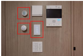
(赤枠部分) 左上: 温湿度センサー 左下: 人感センサー 右: スマート照明スイッチ