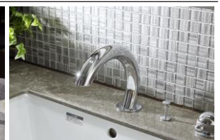
非接触洗面化粧台水栓

※7: 掲載の室内写真は「クレヴィアたまブラザー」モデルルーム(Dクイプ503号室・メニュープラン・カラーセレクト:ソフトグレイージュ)を撮影(2021年9月)したものにCG処理を施しており、造作家具・照明・装飾用小物・オプション(有償)家具・調度品等は、販売価格に含まれておりません。無償セレクト・有償オプション・設計変更には申込期限があります。