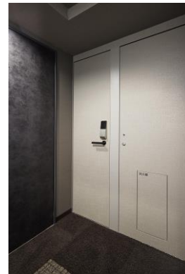
＜専用宅配ボックス＞ 解錠前

※4: 設置されているゴルフバッグ等の備品は販売価格に含まれておりません。専用宅配ボックスのサイズは、住戸により異なります。指定宅配会社は未定です。各住戸に宅配ボックス使用料がかかります。