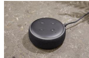
スマートスピーカー