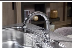
非接触キッチン水栓

働き方が変わり、家の中では家族が共に過ごす時間が増え、衛生観念や社会とのつながり方も変化しています。本物件では全住戸のキッチン・洗面に自動水栓を採用するなど、新しい生活様式に応える機能を実装し、心地よさと安心を追求しました。