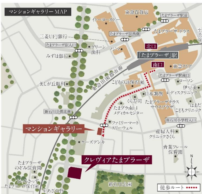
【マンションギャラリー案内図】

所在地：神奈川県横浜市青葉区新石川 2-5-5 パインビル 2 階 TEL:0120-686-033 営業時間：平日 11:00～18:00、土日祝 10:00～18:00 定休日：水曜日・木曜日(祝日除く)