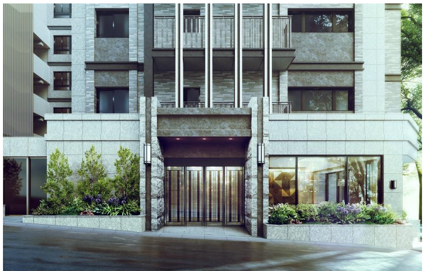
エントランス完成予想CG