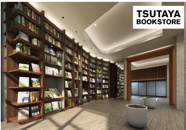
ギャラリーラウンジ完成予想CG

まるで美術館の中にいるように芸術に触れあえる空間「ギャラリーラウンジ」。各所に五感を刺激するテーマを散りばめ、ワンランク上のデザイン空間を演出します。