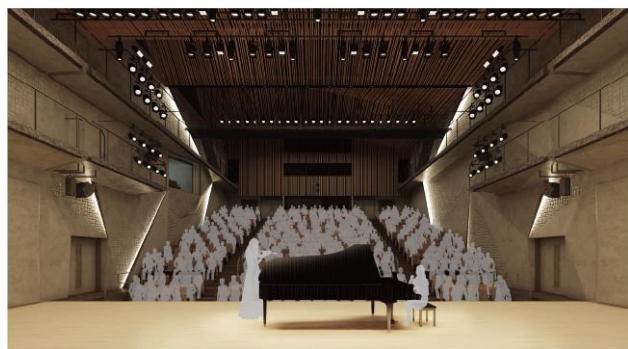
文化・芸術ホールイメージパース(提供:神戸市/設計:(株)久米設計)

本物件と文化・芸術ホール、新西図書館を一体的に整備する新街区では、音楽、舞台芸術、アート、書籍など、日常的に芸術文化と触れあえる暮らしを実現します。また、文化施設と本物件の敷地にまたがった交流広場や憩いのプロムナードも設置予定で、イベントなどを通して、西神中央の街に住まう方々や来館者との新しい出会いを演出します。