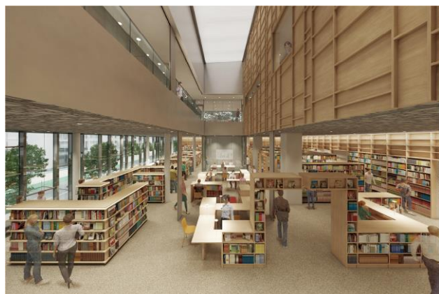
新西図書館イメージパース(提供:神戸市/設計:(株)久米設計)