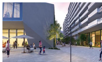
交流広場/憩いのプロムナードイメージパース (提供:神戸市/設計:(株)久米設計)