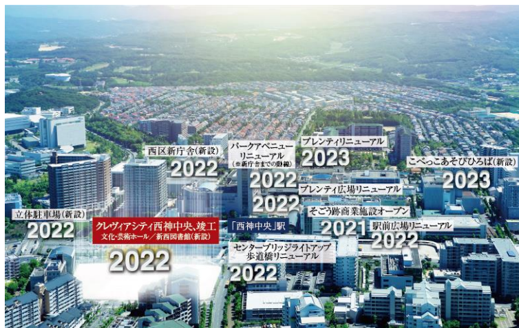
現地周辺写真(2020年8月撮影)

「西区新庁舎」の新設、そごう跡の「西神中央駅ショッピングセンター」や複合商業施設「プレんティ」のリニューアル、駅前の交流拠点「プレんティ広場」の再整備など様々な事業が予定されており、進化する西神中央の都市機能を享受できる物件です。