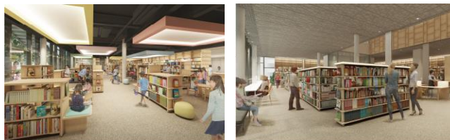
新西図書館イメージパース(設計:(株)久米設計)

面積約3,000㎡、蔵書数約30万冊(開館当初は約20万冊)、座席数約300席を備え、神戸の西地域の拠点図書館となります。「おはなしの部屋」も用意し、小さなお子様連れの方も気軽に立ち寄れる図書館を目指します。