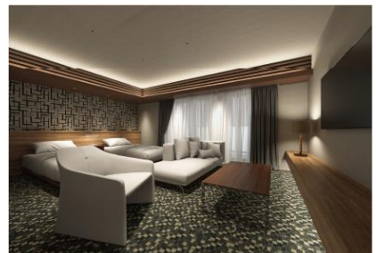
ゲストスイート完成予想CG