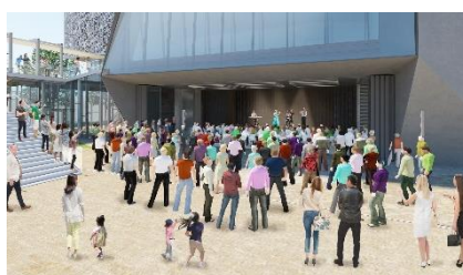
交流広場イメージパース (設計:(株)久米設計)