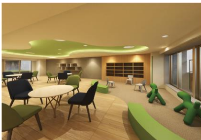
コミュニティラウンジ(キッズコーナー)完成予想CG