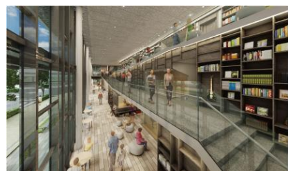
交流モール/アートウォールイメージパース (提供:神戸市/設計:(株)久米設計)