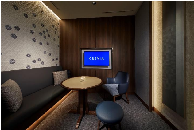
10種類の墨で作られた画仙紙パネルを設えた個室