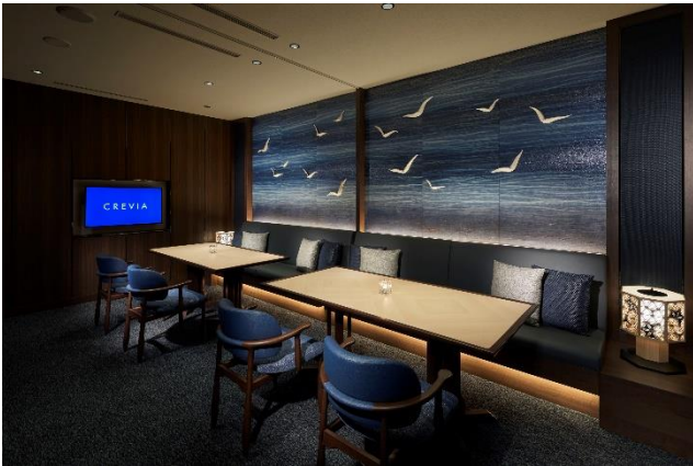
吉祥の和文様を織り込んだ鶴の白磁をあしらった個室

内装は、海外アワード受賞歴を持つ「村山木工」の指物師が手掛けたホール格子スクリーン、「岸本ガラス」の切子ガラスや「ギャラリー点」のオブジェ、「米澤木工所」のウォルナットカウンター、海外でも高く評価されている京友禅工房「三才(さんさい)」の西陣織クロス、元禄元年創業「細尾(ほそお)」の西陣織クロスなど、厳選された日本全国の伝統工芸を随所に設えました。