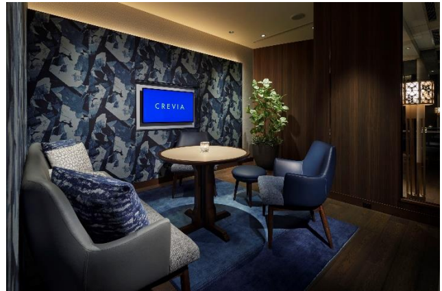
「細尾(ほそお)」の西陣織クロスを設えた個室