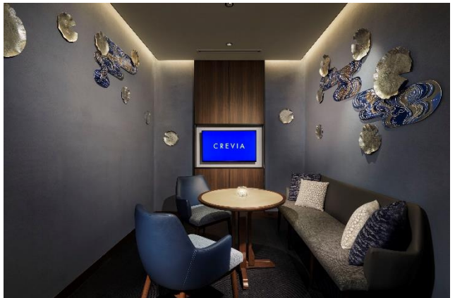
ブルーに染めた左官土壁に水連の金物アートを配した個室