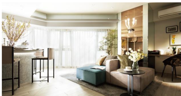
【モデルルーム写真】