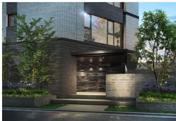
【エントランス完成予想CG】