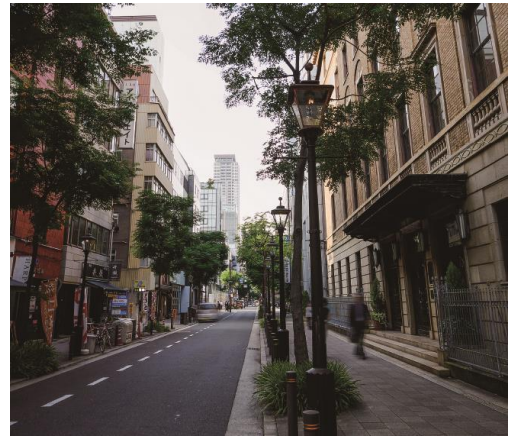
【現地周辺】 徒歩約1分(約80m)

船場地区では、「近代建築のストックを活かす」「通・筋のエリア（界隈）の個性を活かす」「まちを“愉しむ”」を基本方針とし、船場の数ある魅力の中から「三休橋筋と沿道の近代建築」を最も活かしたい資産とし、三休橋筋愛好会などと一体となって事業が進められています。