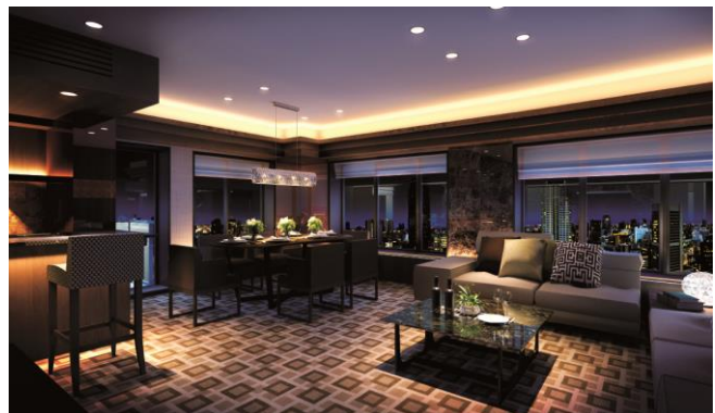
スカイラウンジ完成予想図