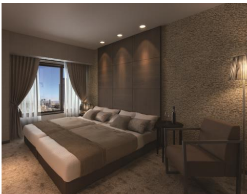
ゲストルーム完成予想図

26階にはスカイラウンジとゲストルームを設置。都市の夜景を眺めながら、寛げる空間を演出しました。