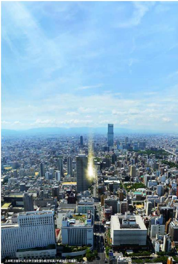
現地周辺の航空写真

上本町エリア・天王寺エリアが生活圈。現地周辺には、多彩なショッピング施設が充実しています。あべのハルカスの開業で全国から注目を集めるあべの・天王寺も日々の生活圈です。