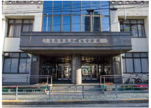
大阪市立夕陽丘中学校