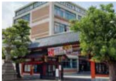
四天王寺中学校・高等学校