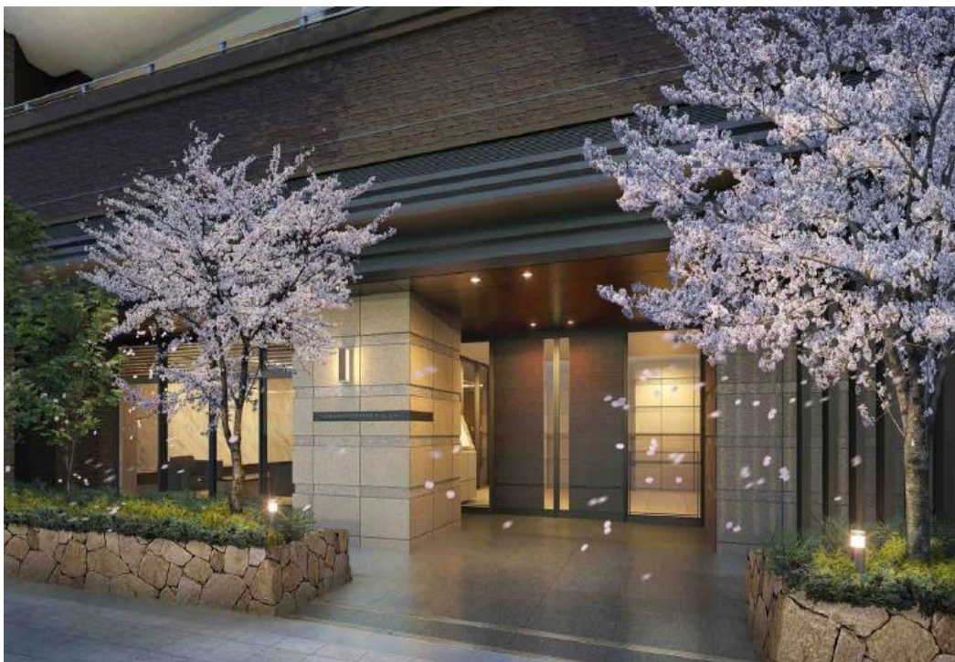
エントランスアプローチ完成予想図