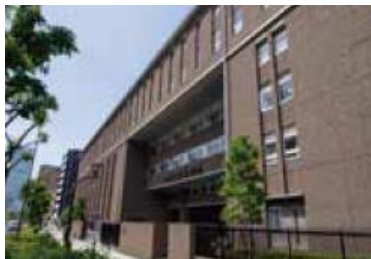
大阪星光学院中学校・高等学校