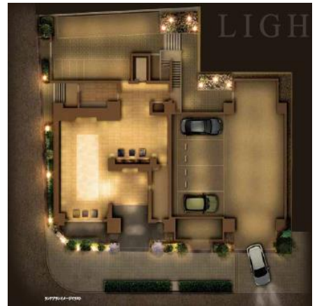
ランドプランイメージイラスト

ダイキン工業(株)オー・ド・シエル蓼科 セミナーハウス (平成27年照明学会普及賞) (平成27年北米照明学会Illuminaition Awards Award of Merit)