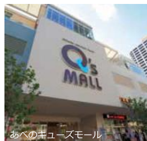
あべのキューズモール