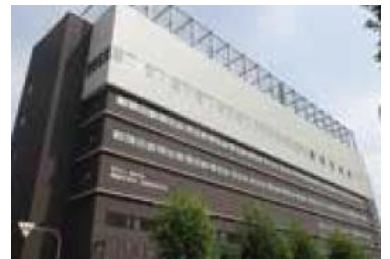
清風中学校・高等学校