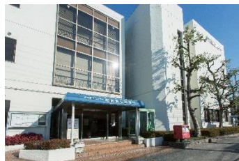
休日急病診療所 徒歩6分(約450m)