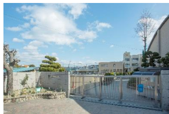
市立春日小学校 徒歩7分(約540m)