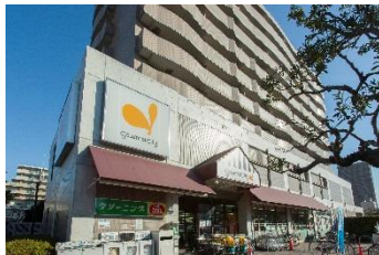
グルメシティ上穂積店 徒歩1分(約70m)