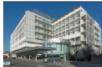
大阪府済生会茨木病院 徒歩2分(約140m)