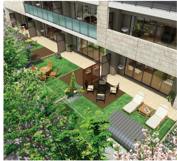
専用庭完成予想図