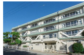
市立西中学校 徒歩5分(約390m)