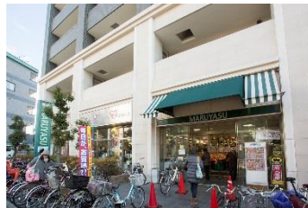
マルヤス茨木駅前店 徒歩7分(約530m)