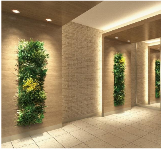
エントランス完成予想図

また、1階住戸の専用庭を日比谷花壇が3つのスタイルでコーディネートし、入居者は好みのスタイルを無償で選ぶ事が出来ます。さらに専用庭には、日比谷花壇がデザインを手がけたプランター植栽も3種類設置し、入居者が無償で選べるなど、1階住戸ならではの「庭のある暮らし」を提案しています。