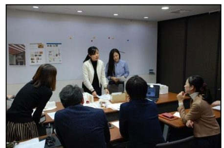
■プレゼンテーション風景