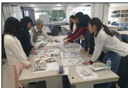
■学内でのプラン作成風景