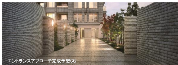
エントランスアプローチ完成予想CG