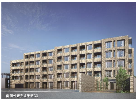
南側外観完成予想CG

重厚と洗練が調和した5階建てレジデンス。凹凸による陰影・風合いのある表情を持つ外壁が格調高さを演出します。