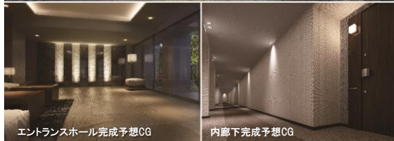
エントランスホール完成予想CG