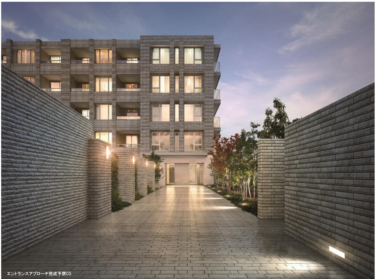
エントランスアプローチ完成予想CG