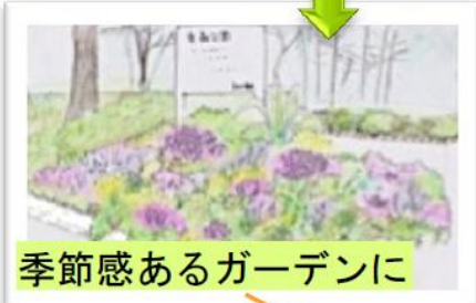
季節感あるガーデンに