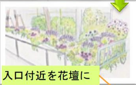
入口付近を花壇に