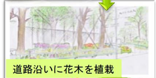
道路沿いに花木を植栽