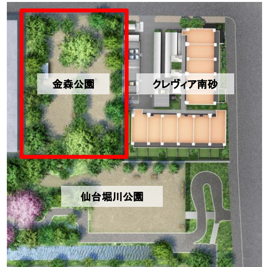
金森公園とクレヴィア南砂の位置関係

今後は、意見交換会・ワークショップでまとめたガーデンデザインに基づいて公園の改修工事を実施します。また、4月27日にどなたでも参加可能なガーデニングイベントを開催いたします。ガーデニングイベントでは、参加者全員でお花を植えて公園内を彩っていきます。