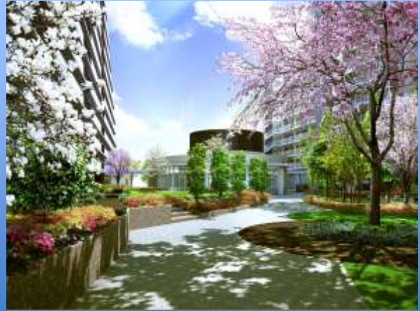
■「フォーシーズンガーデン」完成予想CG