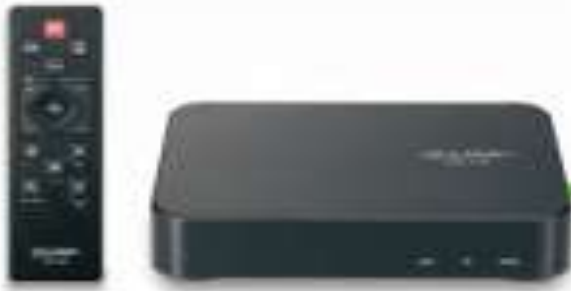
■セットトップボックス

各専有部に設置する機器「セットトップボックス」により、ご自宅のテレビの画面で電力使用量を見える化します。エコネットライト対応家電を節電コントロールし効率的に省エネを図ることが可能です。