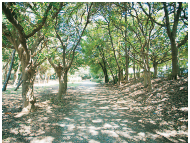
辰巳の森緑道公園