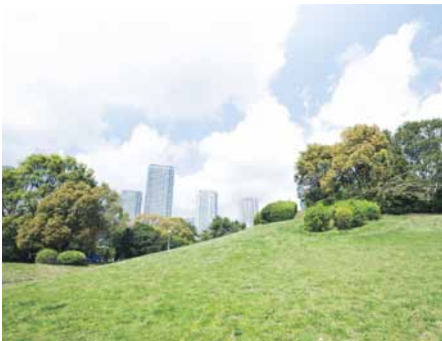
辰巳の森海浜公園

クレヴィア辰巳が誕生する辰巳には、合わせて約40haを超える広大な公園が身近にあります。 バーベキューをはじめ、テニスやガーデンゴルフが楽しめる「辰巳の森海浜公園」へは、わずか徒歩5分。 またジョギングやサイクリングに最適で、春には花見客で賑わう「辰巳の森緑道公園」も徒歩圏に。 ここ辰巳には、都市生活とともに自然の潤いも身近に感じることができる豊かな毎日があります。