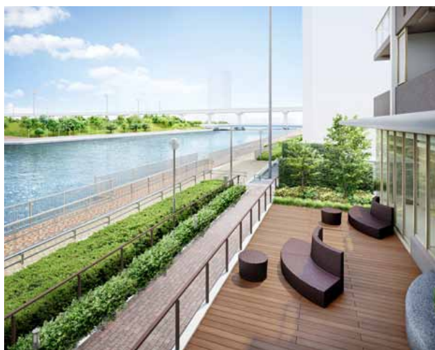
水辺を身近に感じるチャンネルテラス完成予想CG