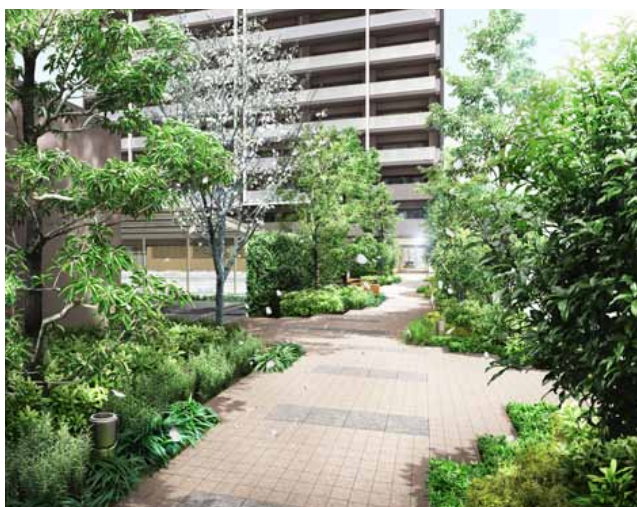
2棟をつなぐグリーンプロムナード完成予想CG