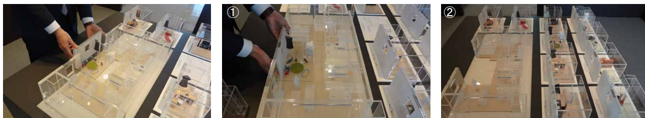
①Bigリビング×布団棚のプランをはめ込んだ例 ②差し替え用の居室×収納の模型(標準+メニュー合わせて全10通り)

クレヴィア辰巳のモデルルームでは、「Mot(モット)私らしきプラン」によるメニュープランを実感できるスケルトン模型をご用意。3つめの洋室部分を、お好みの居室と収納部分に組み替えることで、パズルをはめる感覚のようにライフスタイルに合った空間の比較を体験することができます。