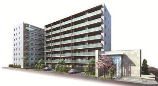
【北東面外観完成予想 CG】