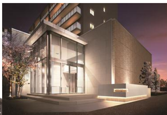
【エントランス完成予想 CG】