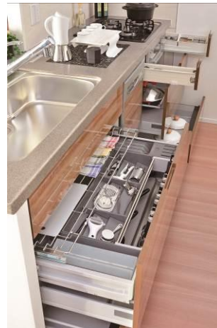
【ツールコンテナ写真】