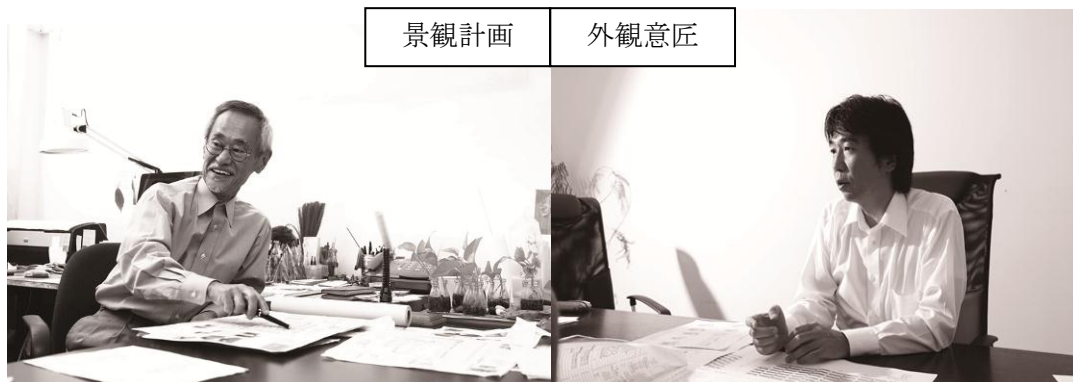
チアシアンドアソシエイツ

本件では、水と光を最前列で享受できるというメリットを主眼に置き、光を受け、水の流れを反映させ、さらに対岸の公園の緑とも対になるランドマークを創出することを意図して、2人のデザイナーが感性を共鳴させました。景観計画はチアシアンドアソシエイツが、外観意匠はアルキフォルマがそれぞれ担当しています。