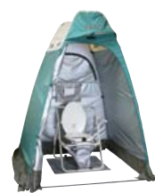
マンホールトイレ(参考写真)