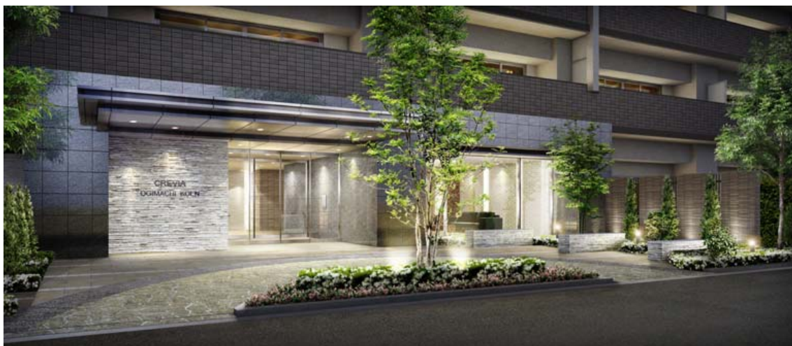
エントランス完成予想図