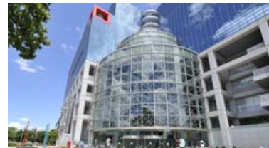
キッズプラザ大阪／徒歩5分(約370m)