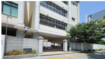
市立堀川小学校／徒歩9分(約680m)