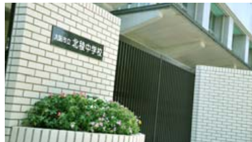
市立北楼中学校／徒歩13分(約1,020m)