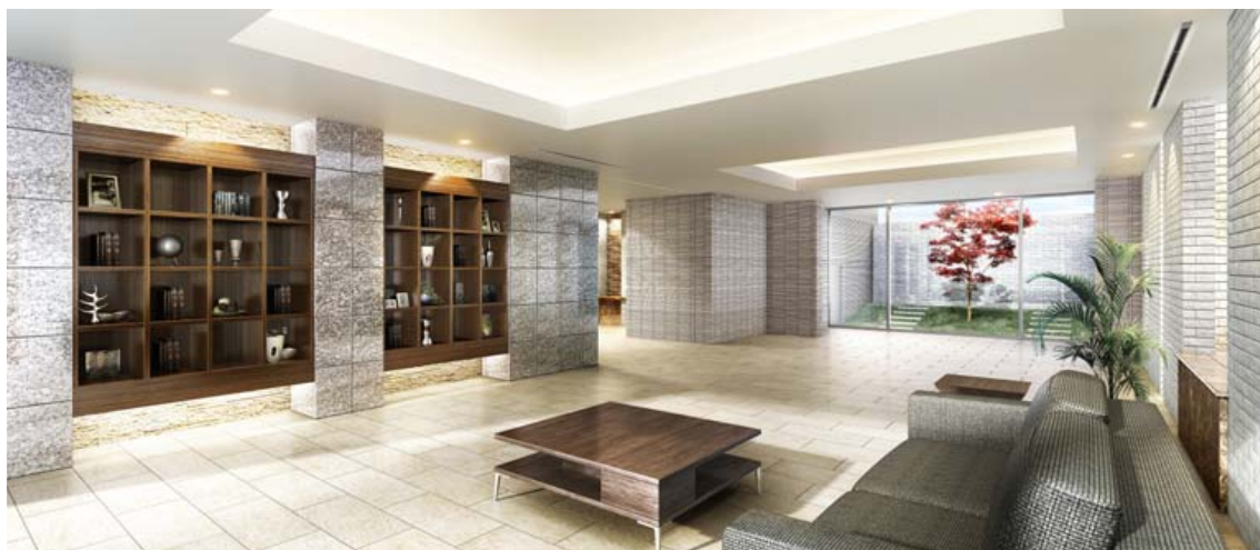
ラウンジ完成予想図