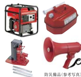
防災備品(参考写真)