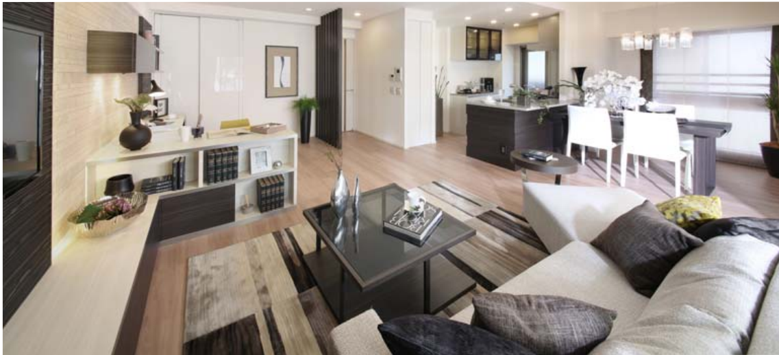
リビング・ダイニング