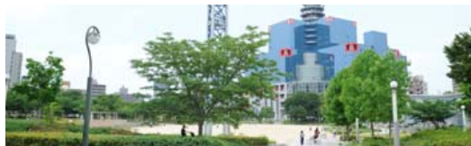
扇町公園／徒歩4分(約320m)

子どもは2,3歳になると、公園で遊ぶことや地域のサークルなどで社会性が養われていくといわれます。中でも「扇町公園」は市内でも遊具や設備が充実し、子どもの成長を健やかに育む環境が整っています。学ぶ、遊ぶを両立させた子育てに適した立地です。